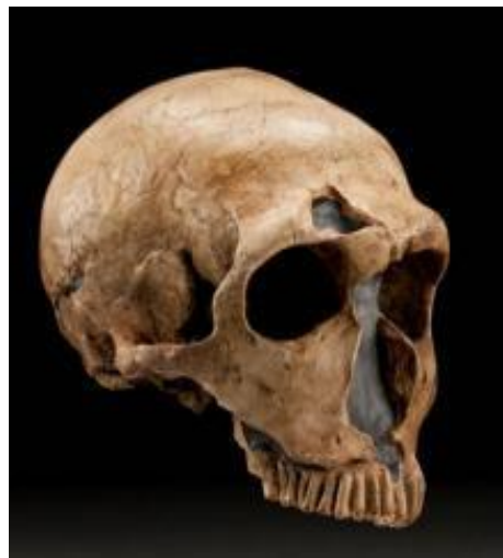
Gambar 1. Homo neanderthal Gambar 2. Tengkorak Kepala Neanderthal

Homo neandertal lumayan cerdas, akan tetapi penampilan mereka masih seperti binatang buas dengan tubuh yang kekar dan kuat mirip dengan beruang dan bulu badan yang mungkin masih sangat lebat. Bukti –bukti yang ditemukan bahwa Homo neandertal telah mampu membuat alat-alat yang sederhana, mengenakan perhiasan, bahkan mengadakan ritual dengan acara tertentu. (Junaidi, 2010: 93). Homo neandertal memiliki ciri-ciri bentuk tubuh sepenuhnya manusia, hidungnya terlihat mancung, ukuran volume otak relatif sudah termasuk dalam kisaran otak manusia modern, tinggi tubuhnya berkisar 160-180 cm, berbahu lebar, berdada cembung dan berotot padat. (Lud Waluyo, 2019: 145). Para ahli sains sependapat bahwa manusia lembah Neandertal adalah leluhur manusia modern, waupun sebagian dari mereka masih meragukan. Mereka juga mampu berbicara dengan baik.